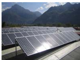
Impianto Fotovoltaico Paradigma Centro Servizi Darzo, Trento Attivo da inizio maggio 2008— Potenza dell'impianto: 19,86 kW