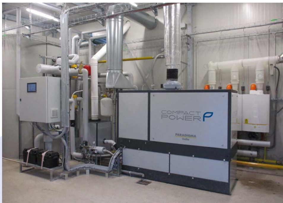
Impianto realizzato con cogeneratore Compact Power 50 kW e tre caldaie Modula III 115 kW