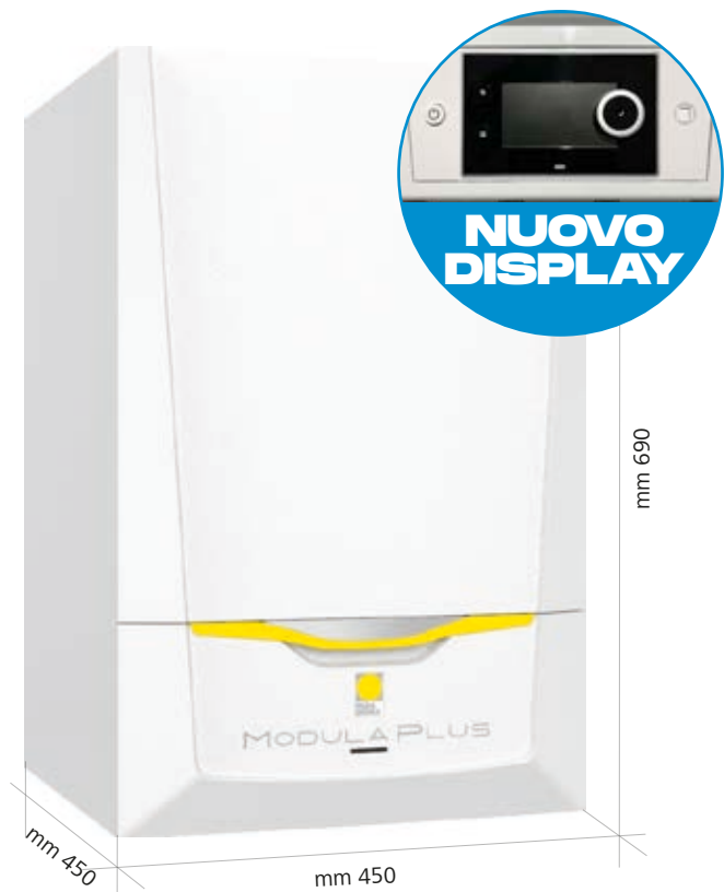
(Misure versione Modula Plus S/DS/C)

È una caldaia murale a condensazione, ideale per abitazioni di medie grandi dimensioni. È disponibile in versione solo riscaldamento o versione combinata riscaldamento e acqua calda sanitaria. La gestione climatica avviene attraverso una sonda esterna che permette alla caldaia di minimizzare i consumi di gas metano. Lo scambiatore in alluminio silicio mantiene le performance della caldaia elevate, anche quando la caldaia è installata in impianti ad alta temperatura. Per ottenere la classe energetica A+ ed accedere alle detrazioni fiscali è sufficiente abbinare una regolazione Paradigma.