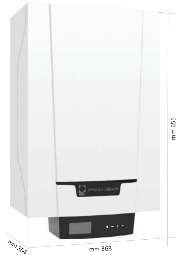
(Misure versione con vaso posteriore)

È una caldaia murale a condensazione ultraleggera e di dimensioni molto compatte, adatta a tutte le esigenze di installazione. È disponibile in versione solo riscaldamento oppure combinata, per riscaldamento e acqua calda sanitaria. Elevata efficienza e rapida risposta sono garantite dallo scambiatore in alluminio silicio, mentre la gestione avviene tramite un'elettronica semplice ed intuitiva, completa di diagnostica per le anomalie. Per ottenere la classe energetica A+ ed accedere alle detrazioni fiscali è sufficiente abbinare una regolazione Paradigma.