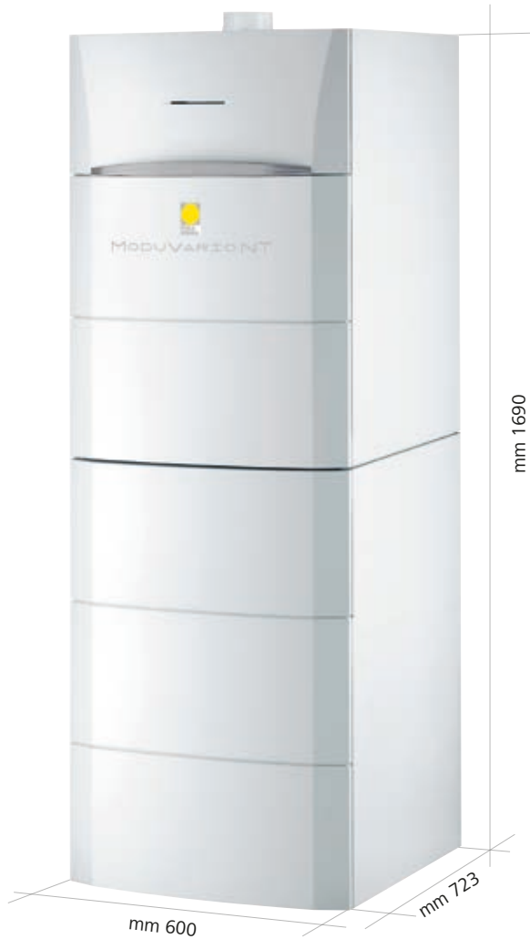
Assemblaggio in verticale

ModuVario NT è ideale per abitazioni di medie grandi dimensioni, con elevato fabbisogno di acqua calda sanitaria. Configurata per la produzione di acqua calda sanitaria e riscaldamento, la caldaia è dotata di predisposizione al solare termico. È abbinabile a bollitore da 100 o 160 litri per soddisfare le diverse esigenze. È assemblabile in verticale e in orizzontale per adattarsi ai differenti spazi abitativi. Per ottenere la classe energetica A+ ed accedere alle detrazioni fiscali è sufficiente abbinare una regolazione Paradigma.